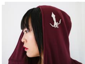
山口 典子 アーティスト 株式会社 デジタルアルティザン 【発表タイトル】 アーティストなんだけど アルティザンも やっています。